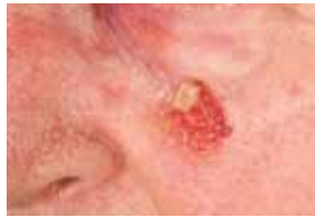
Mit Rötungen, die sich wie Sandpapier anfühlen, kündigt sich dieser Tumor an: der Stachelzellkrebs.

Wenn Ihnen so etwas bei Ihnen oder einem Familienangehörigen auffällt, lassen Sie bitte sofort einen Arzt daraufschauen.