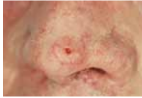
Gefährlich: Ein Basalzellkrebs am Nasenflügel, der umgehend behandelt werden muss.